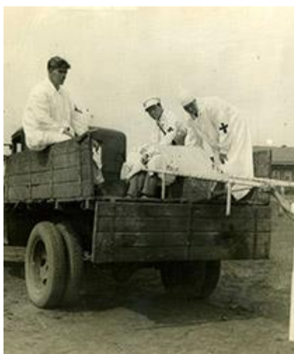
Сбор донорской крови медиками Татарии

В городе была создана сверхсекретная лаборатория “Уран”, работавшая, как и сотни других этого профиля по всей стране, над созданием основы будущей атомной мощи страны. В 1943 году на юго-востоке республики, в Шугурове, была получена первая промышленная нефть. Ряд крупных предприятий за успешное выполнение производственных планов награждены орденами, более 1200 работникам промышленности были еще во время войны вручены правительственные награды, включая боевые ордена Красного Знамени и Красной Звезды.