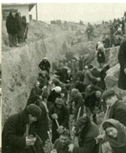
Строительство Волжского оборонительного рубежа