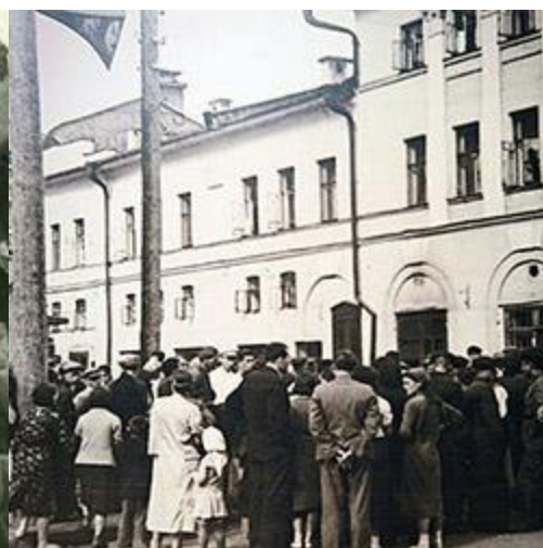
Жители Казани слушают сообщение Совинформбюро

В Казани обрели свой второй дом десятки тысяч эвакуированных граждан. Ее население по сравнению с довоенным уровнем уже к весне 1942 года возросло с 401 до 515 тысяч человек. Жители города по-братски тепло и радушно встречали украинцев и белорусов, эстонцев и латышей, граждан других национальностей. Делились с ними жильем и продуктами питания.