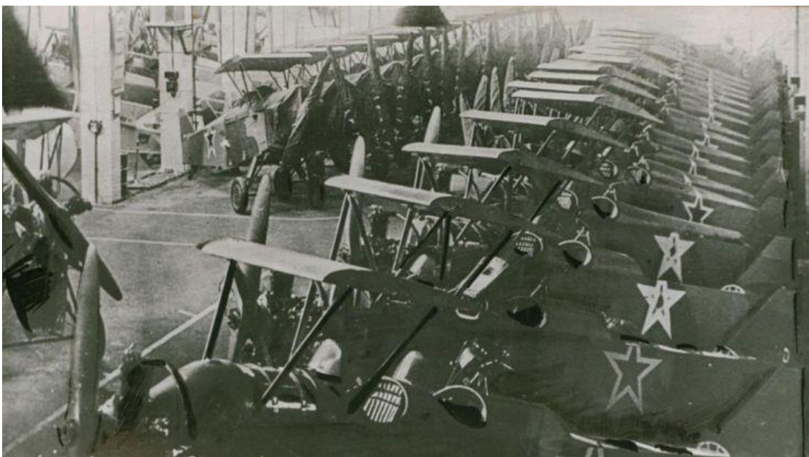
Ночные бомбардировщики У-2 (ПО-2) в цехе сборки завода № 387 Казань. 1943

На предприятиях республики производились снаряды и взрыватели, патроны и бомбы, противопехотные и противотанковые мины, авиационные и танковые приборы, парашюты, десантные суда, оптические приборы, средства связи, обмундирование, обувь, продукты питания и многое другое,