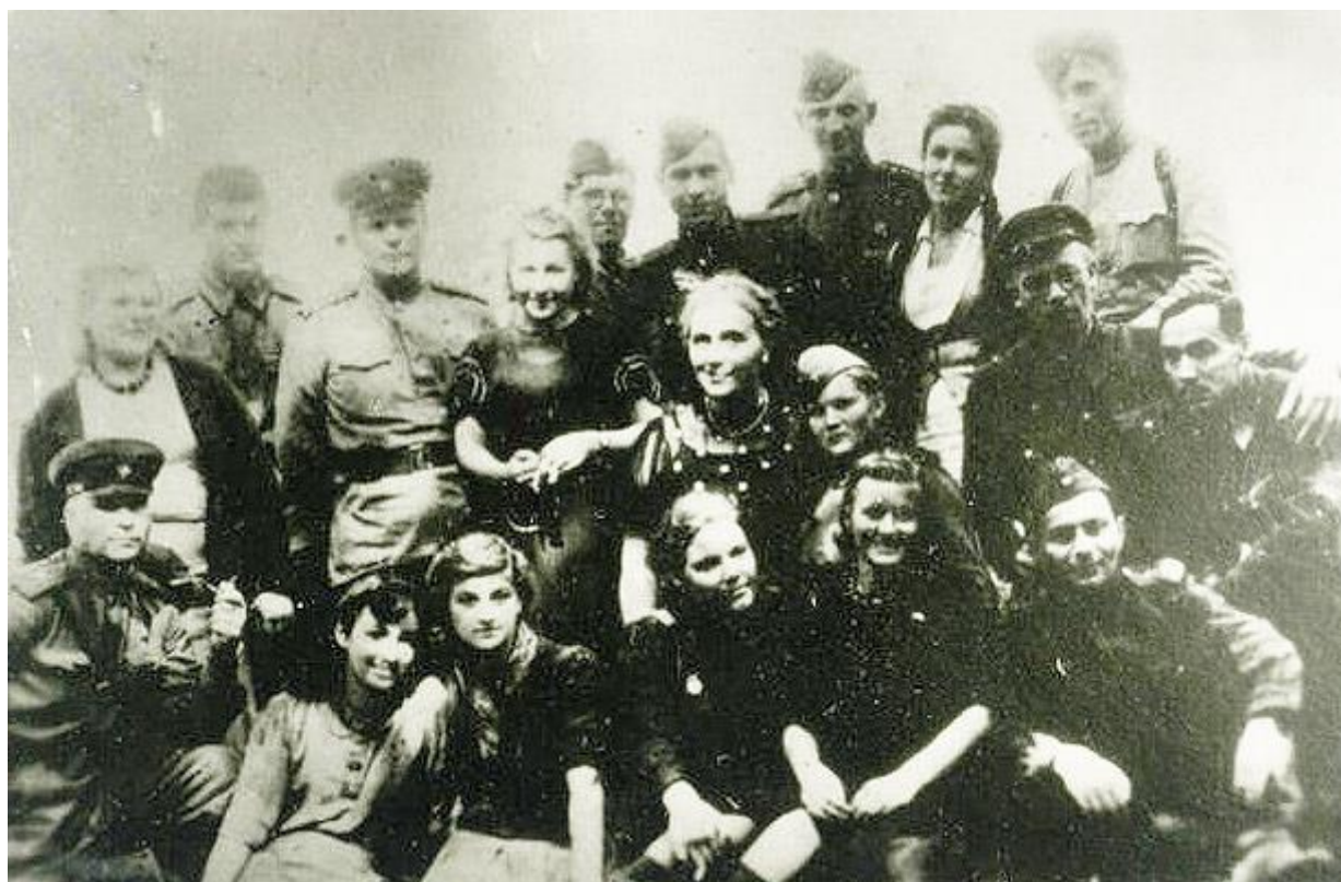
Татарские артисты на Брянском фронте

Вместе с другими республиками и областями Поволжья, Урала и Сибири Татарская АССР являлась могучим арсеналом страны, одной из основных ее военно-промышленных баз по обеспечению фронта боеприпасами, вооружением и снаряжением.