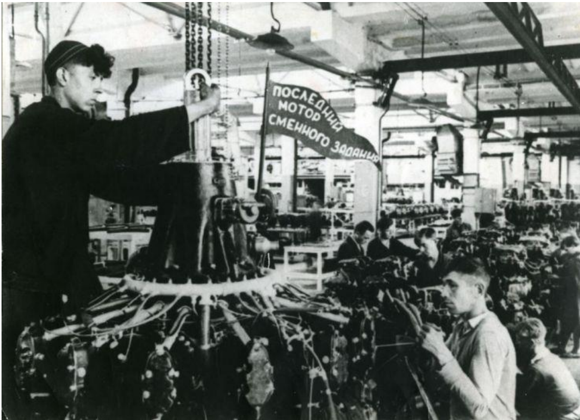
Казанский авиационный завод имени С.П. Горбунова