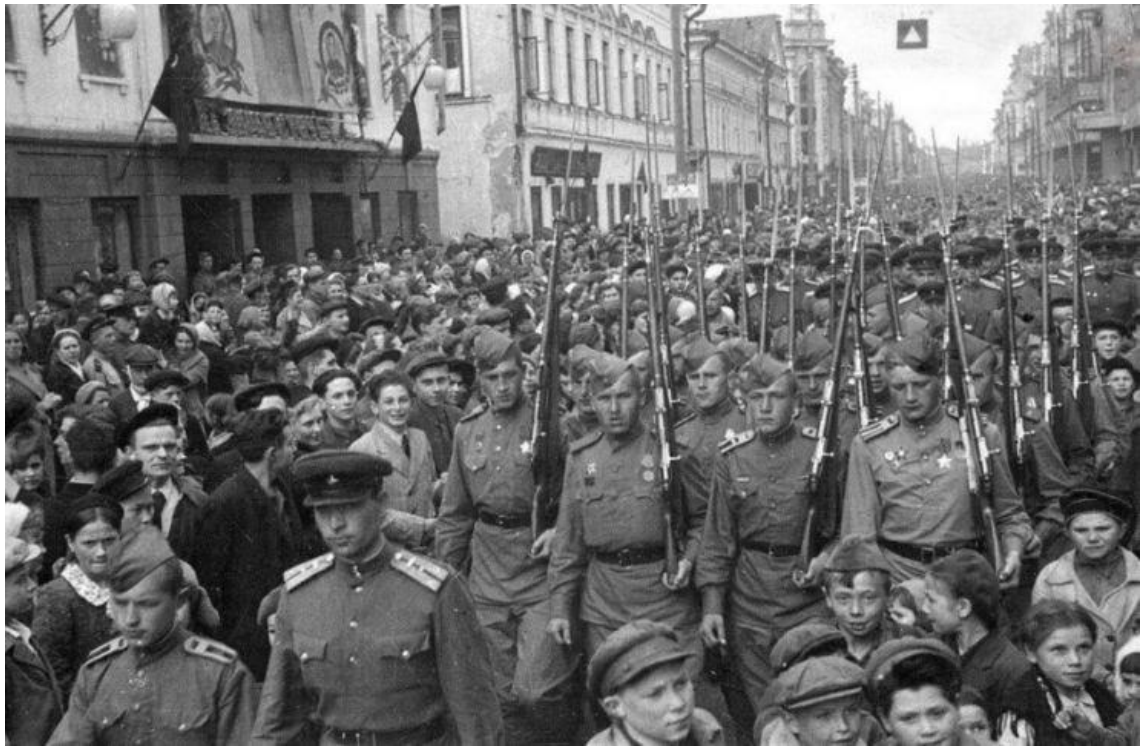
Май 1945 года на ул. Баумана Казань